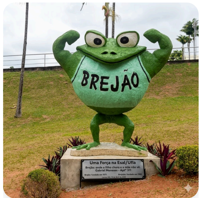
Monumento do Sapo do Brejão "Uma Força na ESAL/UFLA" Lavras, 19 de abril de 2025

A obra se une a outras produções do artista no campus, como a Formiga Gigante e o Gafanhoto do Departamento de Entomologia, tornando o Brejão parte da coleção de arte pública da UFLA.