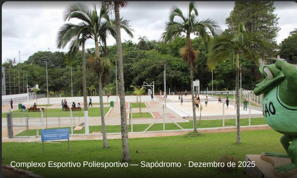
Complexo Esportivo Poliesportivo — Sapódromo · Dezembro de 2025