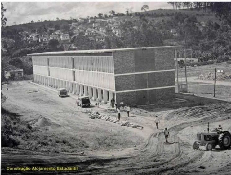
Construção Alojamento Estudantil

Clique nas imagens para ampliar. Registros do presente e dos encontros de ex-moradores.